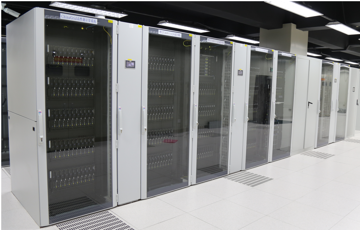
图 1: 曙光TC4600百万亿次超级计算系统